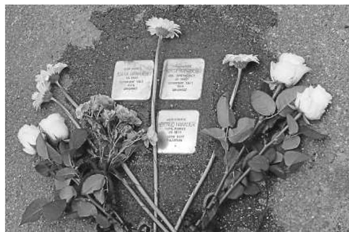
Stolperstein-Verlegung aus dem Jahr 2019

Zur Erinnerung an die Opfer der nationalsozialistischen Verfolgung werden in der Heilbronner Kernstadt am Donnerstag, 29. Juni 22 neue Stolpersteine verlegt. Die Veranstaltung beginnt um 14.00 Uhr in der Wartbergstraße 50. Alle interessierten Bürgerinnen und Bürger sind zur Teilnahme am Gedenkweg oder zum Gedächtnis an den einzelnen Stationen herzlich eingeladen.