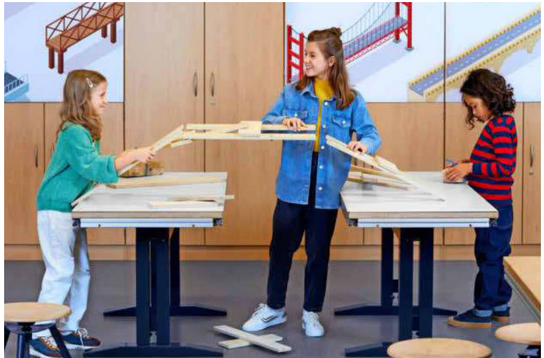
Neue Laborkurse für Schüler bietet die experimenta, um Lernlücken aus der Corona-Zeit zu füllen. Gefördert wird dies durch ein Aktionsprogramm der Bundesregierung.

Die Vorträge sind ein Angebot von Literaturhaus Heilbronn und Abendgymnasium Heilbronn am Kolping Bildungszentrum in Kooperation mit der Akademie für Innovative Bildung und Management Heilbronn-Franken (aim). (red) INFO: Weitere Infos und Streaminglinks gibt es unter https://literaturhaus.heilbronn.de/sternchenthemen .