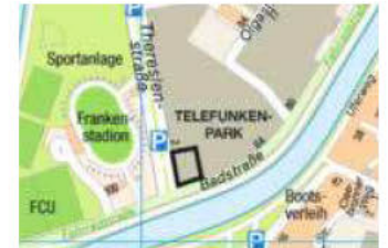
Kartengrundlage: Vermessungs- und Katasteramt

Heilbronn, 28.02.2022 Stadt Heilbronn Bürgermeisteramt In Vertretung Christner, Bürgermeisterin