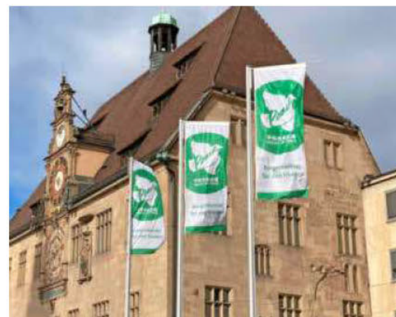
Als Zeichen für den Wunsch nach Frieden wehten auf dem Marktplatz Flaggen der Mayors for Peace.

Die schockierenden Entwicklungen gar nicht weit weg von uns zeigen einmal mehr, wie wichtig für uns Menschen eine gelebte Demokratie, ein friedvolles Miteinander und ein guter Zusammenhalt sind. Das müssen wir uns jeden Tag aufs Neue vor Augen führen. Machen wir uns bewusst, dass unsere privilegierte Situation mit soliden und stabilen politischen Verhältnissen keine Selbstverständlichkeit ist, sondern permanent verteidigt werden muss.“