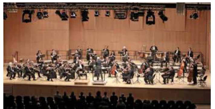
Das Heilbronner Sinfonie Orchester spielt „Schubert in Vollendung“ am Sonntag, 20. März, 15 und 19.30 Uhr, im Theodor-Heuss-Saal der Harmonie.

Das Käthchen erzählt. Dienstag, 22. März, 18 Uhr, Robert-Mayer-Denkmal.