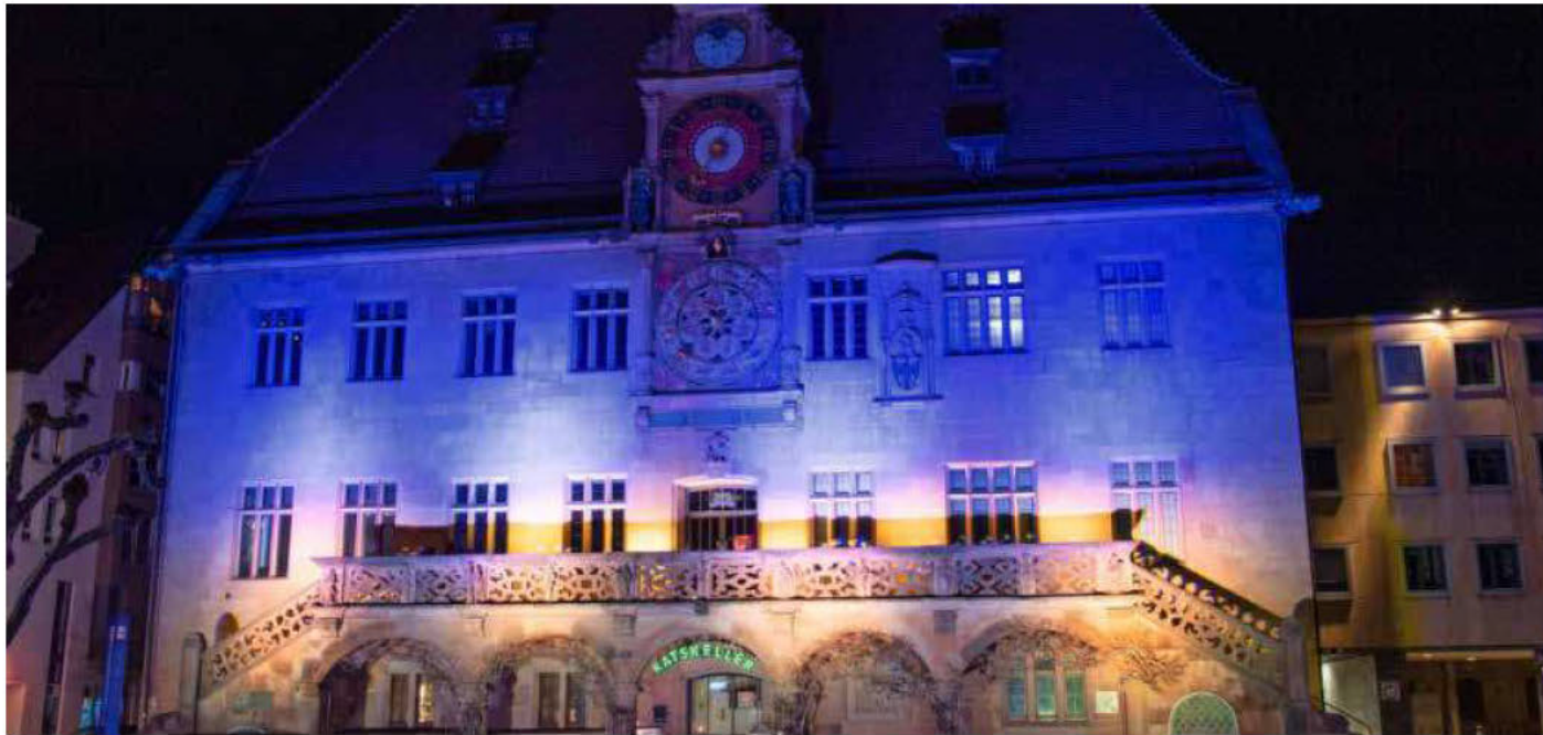
Solidarität mit der Ukraine: Zwei Tage nach Putins Angriff erstrahlte das Heilbronner Rathaus in blau und gelb.