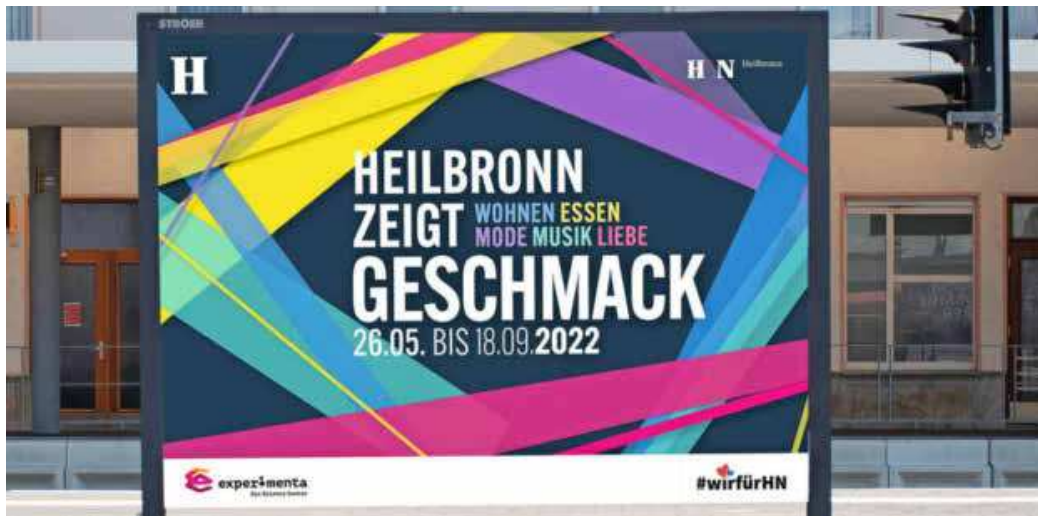
Mit „HN zeigt Geschmack“ greift die Heilbronn Marketing GmbH eine Ausstellung der experimenta auf und plant unter diese Motto bewährte und neue Formate in der Innenstadt.