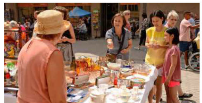
Rund um den Kiliansplatz findet am Samstag, 14. Mai, 11 bis 18 Uhr, der traditionelle Antik- und Trödelmarkt statt.

Stadt am Fluss. Freitag, 13. Mai, 15.30 Uhr, Anlegestelle am Götzenturm.