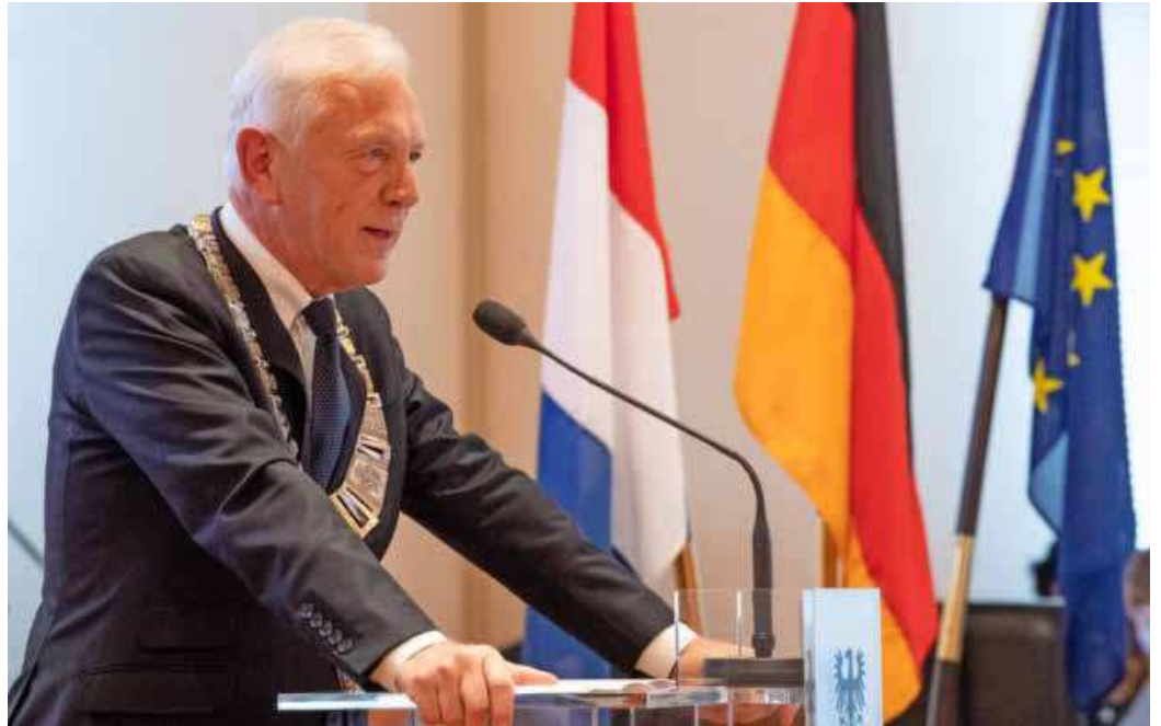
OB Mergel nach seiner Verpflichtung: „Mit Demut und Dankbarkeit und gehörigem Respekt vor der Größe des Amtes gehe ich in meine zweite Amtszeit.“

Mergel: Es sind selbstverständlich die verschiedensten Themen, die die Menschen beschäftigen. Aber eines, auf das ich immer wieder angesprochen wurde, ist unsere Innenstadt. Dageht es um die Zukunft und die Qualität der Einzelhandelslandschaft, aber auch ganz konkret um das persönliche Sicherheits- und Sauberkeitsempfinden der Bürgerinnen und Bürger. Auch wenn Heilbronn nachweislich der sicherste Stadtkreis in Baden-Württemberg ist, werden wir weiterhin gemeinsam mit der Polizei intensiv daran arbeiten, dass dieser Fakt auch die gefühlte Wahrheit aller Besuche-