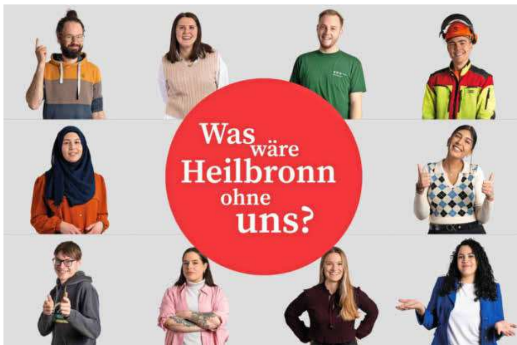
Bei der Bildungsmesse Heilbronn am 6. und 7. Mai berichten auch städtische Auszubildende – hier ein Auszug aus der Teaserbroschüre der Stadt Heilbronn – über ihre Ausbildungsberufe.