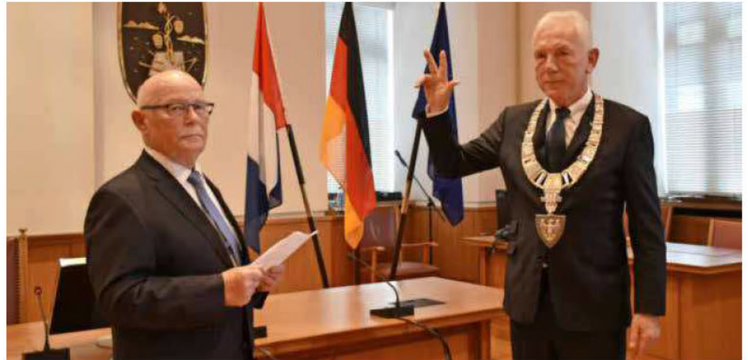
Stadtrat Herbert Tabler verpflichtet Oberbürgermeister Harry Mergel im Großen Ratssaal für seine zweite Amtszeit.

Neben guten Wünschen und einem Blick auf die anstehenden Herausforderungen überreichte sie Mergel eine ganz konkrete Unterstützung für die kommende Amtszeit: den Beihilfungsbescheid für die derzeit im Bau befindliche BUGA-Brücke mit einer Zuschusssumme von rund 4,8 Millionen Euro (siehe auch Seite 5).