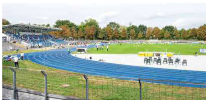
Bei der EM 2024 könnte das Frankenstadion Trainingsstätte für eine teilnehmende Mannschaft werden.

furt im Südcluster des Ausrichtungskonzeptes. Um den teilnehmenden Nationalteams optimale sportliche Bedingungen zu bie-