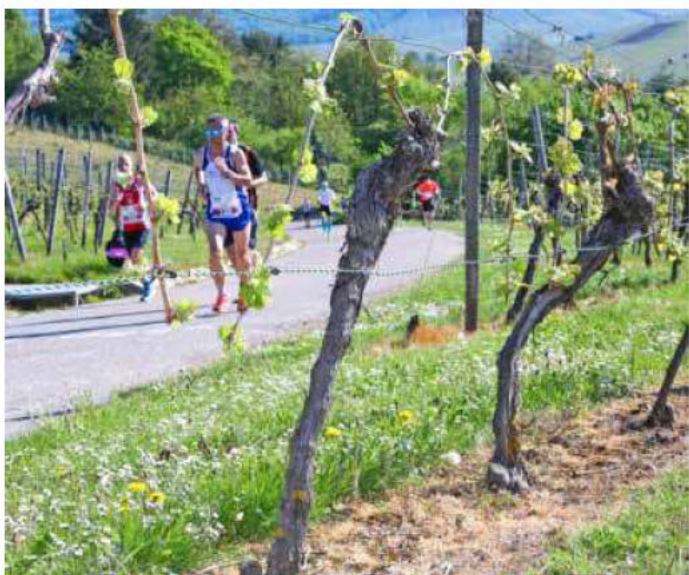
Wegen des 20. Trollinger-Marathons mit etwa 3500 Läufern kommt es am 7. und 8. Mai zu Straßensperrungen.