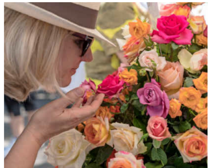
Die Heilbronner Gartenträume finden am Samstag, 2. Juli und Sonntag, 3. Juli in der Unteren Neckarstraße statt.

City Dinner Tour. Dienstag, 12. Juli, 18 Uhr, Innenstadt.