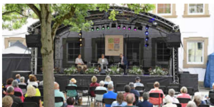
Von Montag, 4., bis Freitag, 8. Juli, und von Montag, 10., bis Freitag, 15. Juli, startet wieder Wissenspause im Deutschhof.

INFO: Eine Anmeldung ist bis Samstag, 16. Juli, unter www.salzwerke-dialog.de erforderlich.