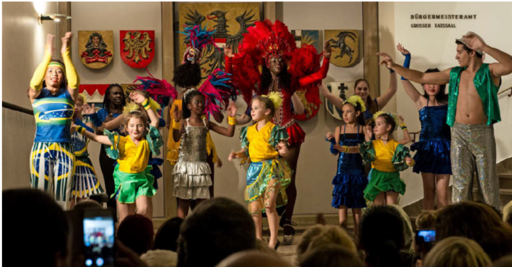
Kunst, Tanz, Theater, Musik an den unterschiedlichsten Orten, das gibt es bei der „Lange Nacht der Kultur“ kostenfrei zu erleben.