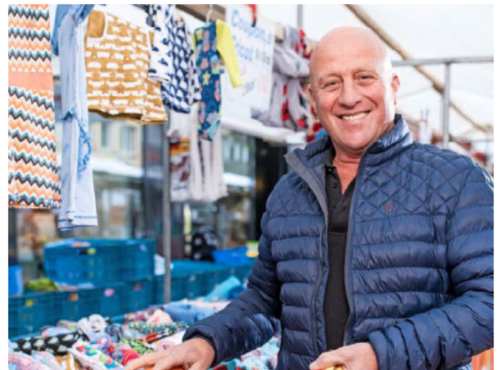
Mit einer Vielfalt an herbstlichen Stoffen und Zubehör gastiert der Deutsch-Holländische Stoffmarkt am Samstag, 8. Oktober, 10 bis 17 Uhr, in der Unteren Neckarstraße.

Erfolgreich Nachhaltig. Samstag, 8. Oktober, 11 Uhr, Friedrich-Ebert-Brücke/Marrahaus.