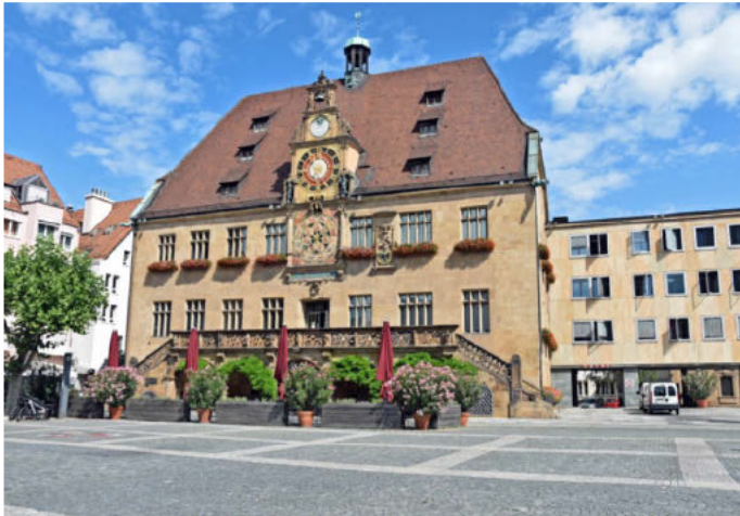
Die Stadtverwaltung Heilbronn ist digital gut unterwegs. Das zeigt der Smart City Index 2022 der Bitkom.

rat hatte im März 2019 eine umfassende Digitalstrategie beschlossen, die auf alle Lebensbereiche des Gemeinwesens abzielt. Mit dem Konzept sogenannter „Reallabore“ sollen dabei Versuchsräume für die gesamte Stadtgesellschaft entstehen.