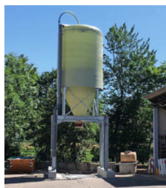
Das neue Salzsilo im Frankenbacher Bauhof.

Um den Winterdienst weiter zu optimieren, wurde im Bauhof Frankenbach ein 30 Kubikmeter fassendes Salzsilo errichtet. Ein gleiches Silo steht bereits seit 2020 in Horkheim in der unteren Kanalstraße. Weitere Standorte für Salzlager des Betriebsamtes befinden sich im Betriebshof in der Austraße sowie in Biberach. (aci)