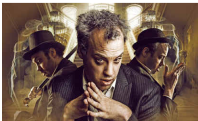
Die Ausstellung „LEBENS(T)RÄUME“ endet mit der Finnisage am Montag, 29. Mai, 16.30 Uhr, auf der Inselfspitze unterhalb der Friedrich-Ebert-Brücke.

Schlenderweinprobe durch die Innenstadt. Freitag, 26. Mai, 17.45 Uhr, Tourist-Information.