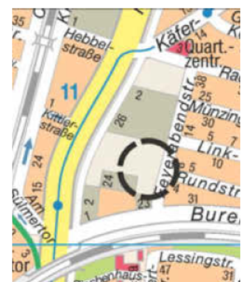
Kartengrundlage: Vermessungs- und Katasteramt

Heilbronn, 02.05.2023 Stadt Heilbronn Bürgermeisteramt In Vertretung gez. Ringle Bürgermeister