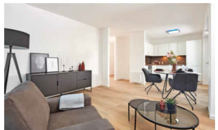
Hell und freundlich präsentieren sich die neuen Musterwohnungen im Hochgelegenen.

das neue Quartier kennen zu lernen, sich vor Ort zu informieren und zwei möblierte Musterwohnungen anzuschauen. Eine Kinderbaustelle und ein Baustellenvesper runden das Angebot ab. Der Eintritt bei diesen Tagen der offenen Baustelle im Stadtquartier Hochgelegenen, Am Gesundbrunnen 11 – 16 Uhr, ist frei. Besucher werden gebeten, die öffentlichen Verkehrsmittel zu nutzen, da es nur eine begrenzte Anzahl an Parkplätzen gibt. Weitere Infos: www.hochgelegenen.de (red)