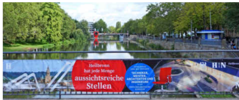
Aussichtsreiche Stellen? Gibt es jede Menge bei der Stadt Heilbronn. Mehr als 200 ganz unterschiedliche Berufe stehen zur Auswahl.