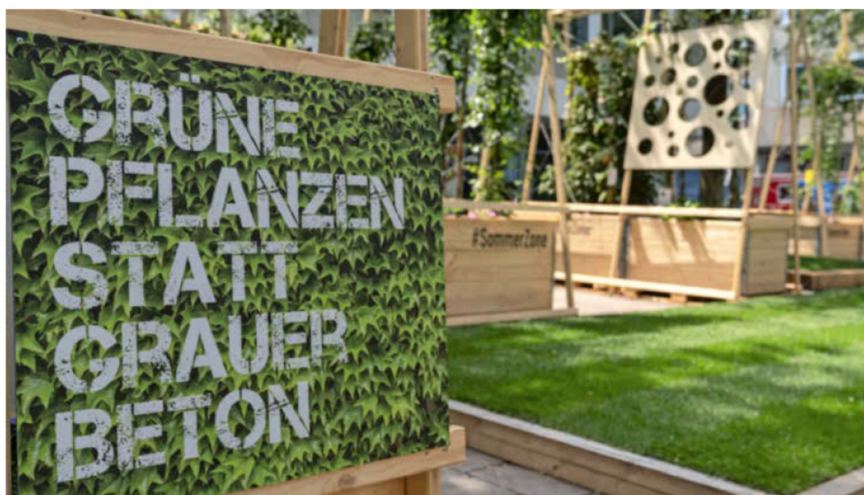
Vertikale Begrünung ist das Thema der Ausstellung in der Lothorstraße, die seit Juni die Sommerzone ergänzt. Am Freitag werden hier Efeu, Kiwi und Hopfen an Besucher der Stadt verteilt.

Ausrichter der Veranstaltung, bei der es auch um internationale Klimagerechtigkeit geht, sind die Lokale Agenda 21 HN, der BUND Heilbronn, die Parents-for-Future, der Bildungspark Heilbronn-Franken, die Naturfreunde, Slow Food sowie die Solawi HN-Mosbach. Mit