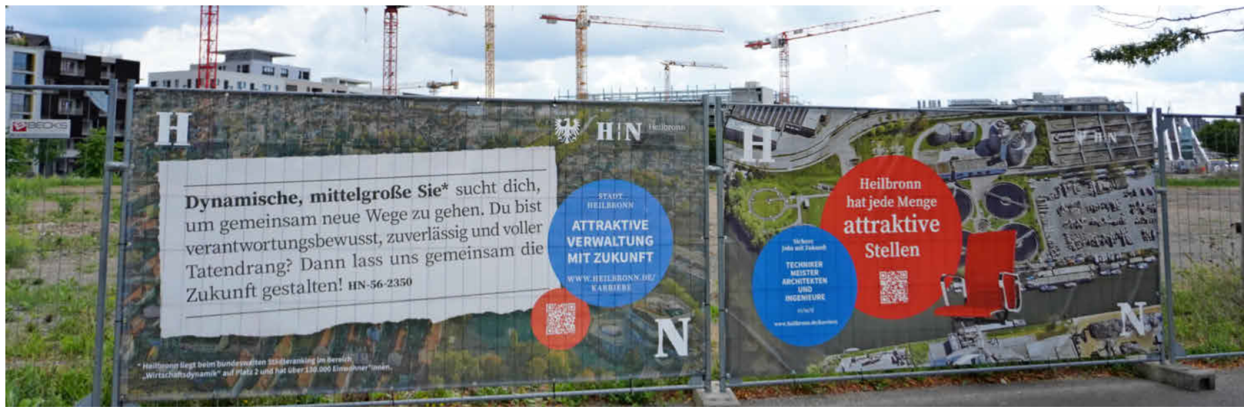
Kontaktanzeige trifft Stellenanzeige – mit dieser ungewöhnlichen Recruiting-Kampagne geht das Personalamt neue Wege.