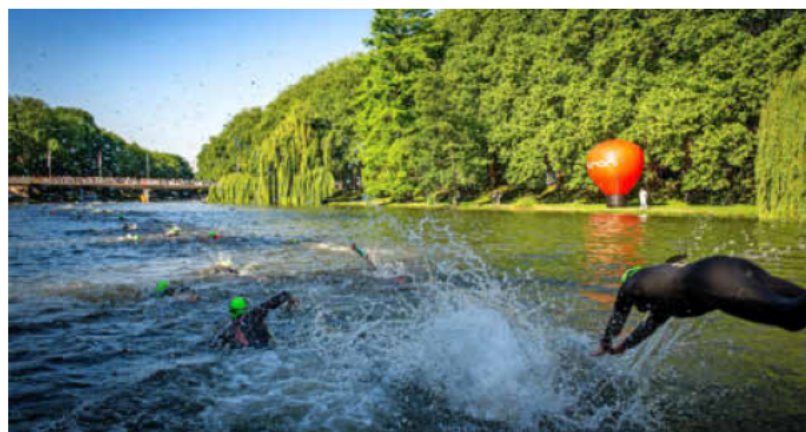
Am Sonntag, 16. Juni, springen die Ausdauerdreikämpfer wieder in den Neckar. Bevor es auf dem Rad und zu Fuß weitergeht.