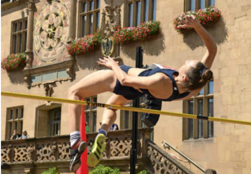
Im August wird der Marktplatz zum Stadion: Zum ersten Mal findet mitten in der Stadt das internationale Hochsprung-Meeting statt.