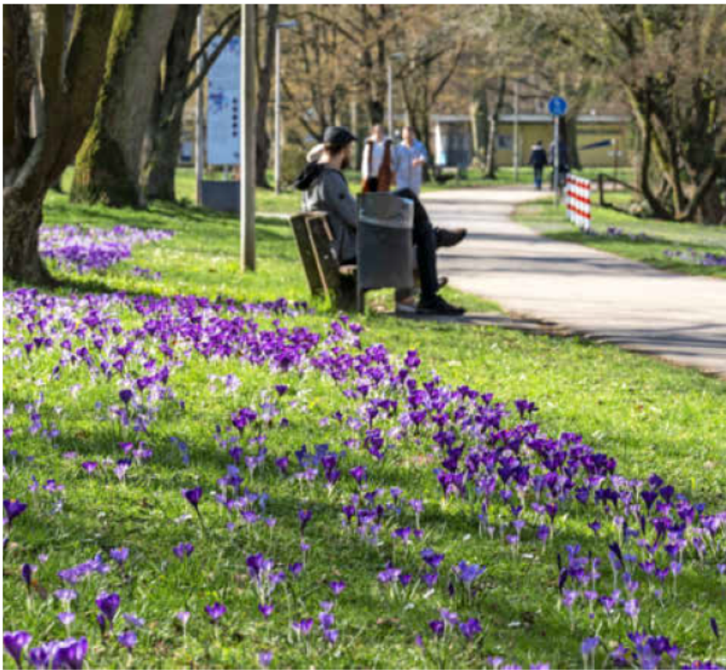
„Frühling lässt sein blaues Band“: Frei nach dem Lyriker Eduard Mörike blühen im März fast 100 000 Krokusse am Neckarufer.

heute den Vorlesungen, heute den Vorlesungen, zwischen den Jahren möchte ich die Zeit nutzen, gemeinsam mit Ihnen einen Blick auf die zurückliegenden zwölf Monate zu werfen, in denen wir in der Verwaltung und mit dem Gemeinderat täglich daran gearbeitet haben, unsere Stadt noch lebenswerter und auch schöner zu machen. Selbstbewusst, mit Optimismus, Tatkraft und Innovationsbereitschaft schauen wir in die Zukunft – sicherlich warten auch 2024 wieder 366 spannende und herausfordernde Tage auf uns.