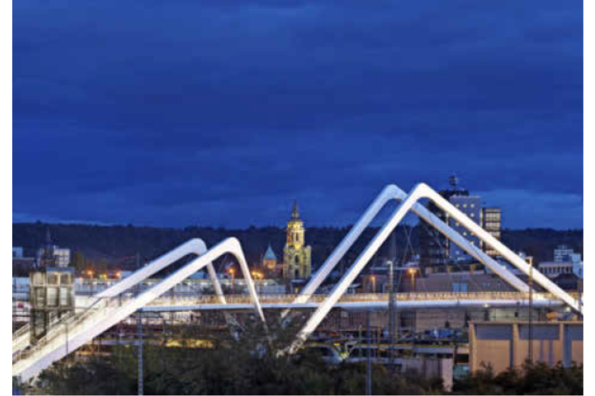
Die BUGA-Brücke fügt sich elegant ins Stadtbild ein. Sie verbindet das Stadtquartier Neckarbogen mit dem Hauptbahnhof und der Bahnhofsvorstadt.