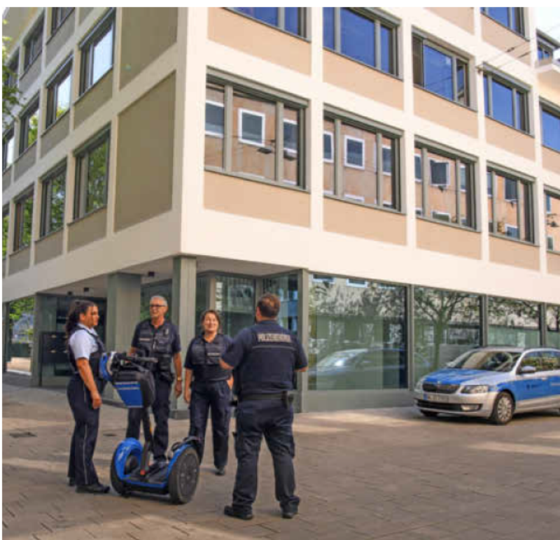
Mit der neuen Dienststelle des Kommunalen Ordnungsdienstes (KOD) in der Lohtorstraße 22 gibt es jetzt eine Anlaufstelle in der Innenstadt.