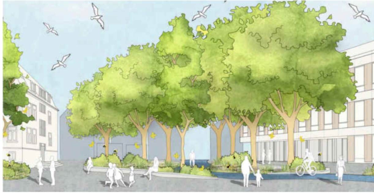
Baubeginn für die neue Neckartalschule soll im Frühjahr 2025 sein. Dann wachsen die Grünwaldschule (links) und die Neckartalschule zu einem Campus zusammen.

Geplant ist ein Abbruch des bestehenden Gebäudes und ein dreigeschossiger Neubau in Holzbauweise. Lediglich für das Untergeschoss, die Treppenhäuser, die Aufzugschächte und