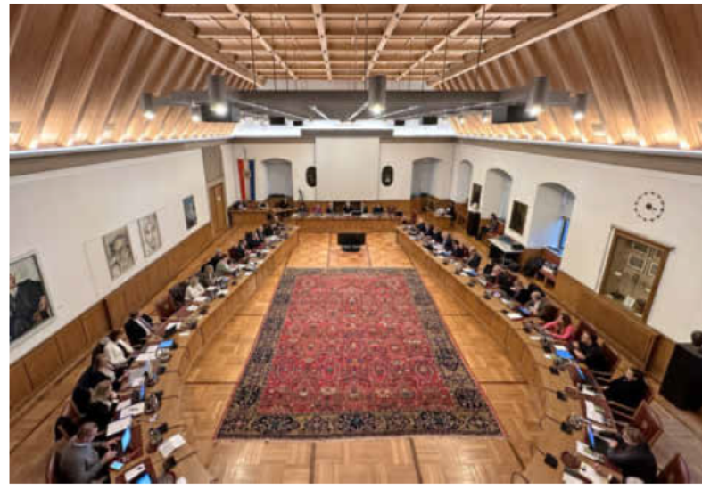
In seiner letzten Sitzung des Jahres 2023 verabschiedete der Gemeinderat Heilbronn den Haushalt 2024 einstimmig.

Erst am Montag hatte der Gemeinderat in einer neunstündigen Sitzung über 300 Finanz- und Deckungsanträge aus den eigenen Reihen beraten und abgestimmt. Insgesamt rechnet die Stadt Heilbronn mit einem positiven ordentlichen Ergebnis von 6,4 Millionen Euro zum Jahresende 2024. Dieses