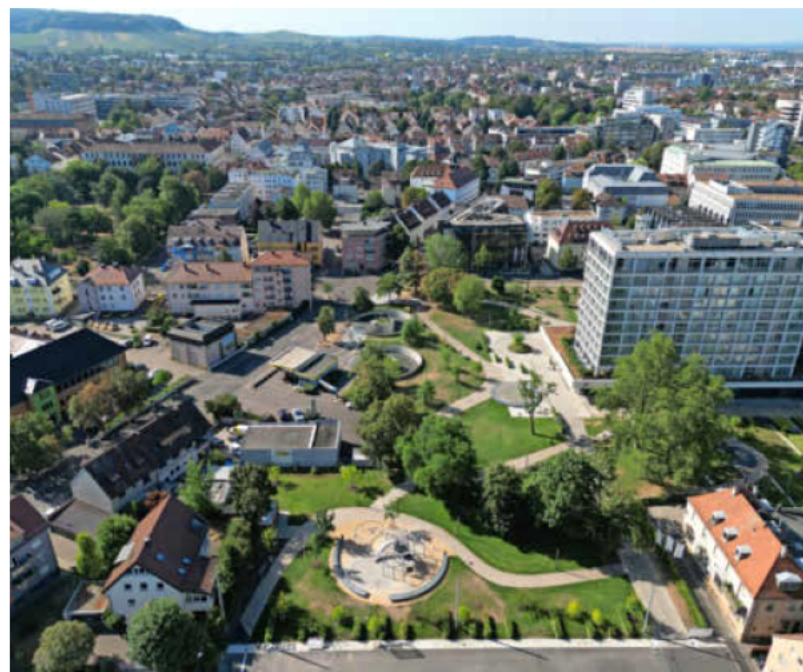
Insbesondere im verdichteten Innenstadtbereich bietet sich ein Wärmenetz an, das mit erneuerbaren Energien gespeist wird.

Bei der Ist-Analyse wird deutlich: Mehr als 89 Prozent der Gebäude in der Stadt Heilbronn sind Wohnhäuser. Industrie-, Gewerbe- und öffentliche Gebäude machen einen deutlich kleineren Anteil aus und spielen bei der Wärmewende deshalb nur eine untergeordnete Rolle. Mehr als drei Viertel der Gebäude wurden vor dem Inkrafttreten der ersten Wärmeschutzverordnung 1977 gebaut. Das spiegelt sich in einer sehr hohen Anzahl von Gebäuden mit niedriger Energieeffizienz wider. Basierend auf Verbrauchswerten wurde ermittelt, dass rund 46 Prozent, also fast