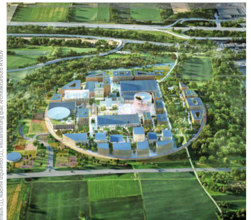
Eine runde Sache: Jetzt ist klar, wie der Innovationspark Künstliche Intelligenz (Ipai) aussehen wird, der im Norden von Heilbronn entsteht.