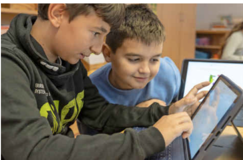
Jedes Kind sowie jede Lehrkraft der Heilbronner Schulen soll zukünftig im Rahmen eines pädagogischen Konzepts kostenfrei ein Tablet bekommen.