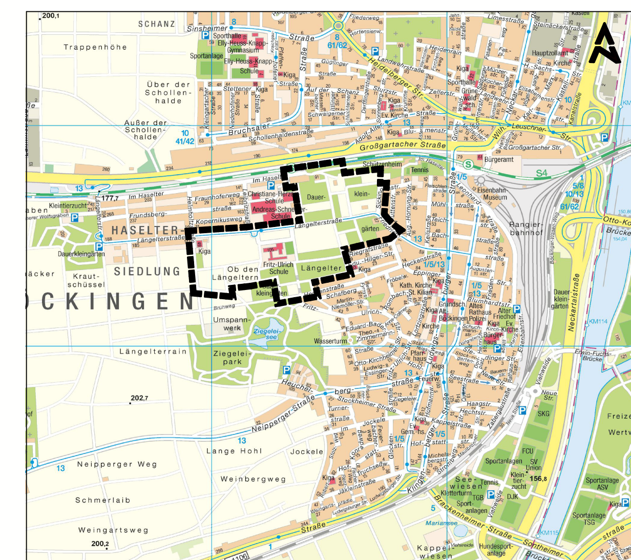
Kartengrundlage: Vermessungs- und Katasteramt