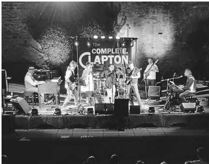
In der Reihe „Heilbronn ist Kult“ treten zahlreiche Bands und Musiker im Deutschhof auf, darunter auch die Band „Complete Clapton“.

Das komplette Programm ist unter www.heilbronn.de/hnistkult übersichtlich als Tabelle eingestellt. Flyer liegen an verschiedenen Stellen aus. Die Veranstaltungen sind kostenfrei, Tickets sind nicht erforderlich - das Platzangebot ist allerdings begrenzt. Die in Kürze eröffnende SITT-Weinbar im Deutschhof sorgt für die passenden Getränke zu den Veranstaltungen.