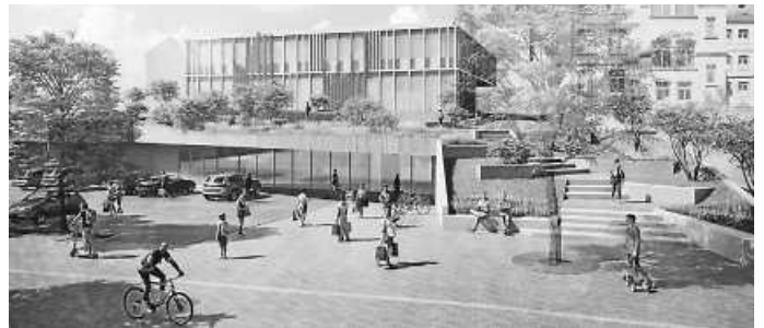
Visualisierung: So soll die Erweiterung der Grundschule Alt-Böckingen aussehen.