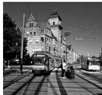
Stadtbahn an der Einfahrt in die Haltestelle Heilbronner Hauptbahnhof.

Wenn die Landesregierung ab 1. März das neue Jugendticket Baden-Württemberg für den Nah- und Regionalverkehr einführt, können sich Auszubildende, Studierende und junge Absolventen in Freiwilligendiensten der Stadt Heilbronn freuen: Die Stadt wird allen jungen Mitarbeiterinnen und Mitarbeitern das Jugendticket kostenlos anbieten und die Kosten komplett übernehmen. Das hat der Gemeinderat am Donnerstag, 16. Februar, beschlossen.