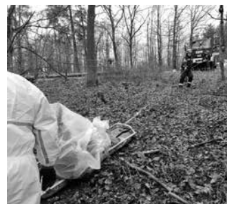
Praktische Übung zur Afrikanischen Schweinepest: Eine Seilwinde und ein Bergungsschleppgerät des Technischen Hilfswerks waren nötig, um ein totes Wildschwein am Waldhang zu bergen.

INFO: Da es derzeit keine Impfstoffe und keine Therapiemöglichkeiten gibt, ist die frühzeitige Erkennung und Bekämpfung von ASP besonders wichtig. Mit Hilfe von Schutzzonen und durch die konsequente Suche und Entfernung erkrankter und verendeter Wildschweine wird versucht, die Seuche einzudämmen und die Ansteckung von Hausschweinen zu verhindern. Die Schutzzonen erlauben es, den internationalen Handel in nicht betroffenen Gebieten aufrechtzuerhalten.