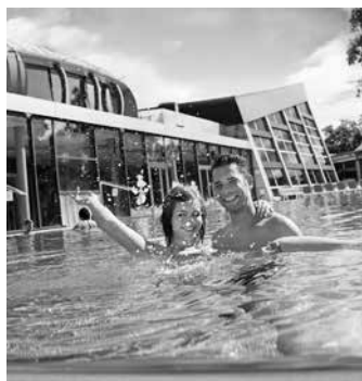
Das Freizeit- und Solebad Soleo kann wie das Hallenbad Biberach und die drei Heilbronner Freibäder mit den kostenlosen Tickets aus dem Begrüßungspaket für Studierende besucht werden.

Bei der Anmeldung wird konkret nach einem Ort in der Innenstadt gefragt, an dem sich etwas tun sollte. Möglich ist es aber auch, nur einen Ortshinweis zu geben, ohne selbst bei der Tour dabei zu sein. Die Teilnehmenden bekommen rechtzeitig vor der Veranstal-