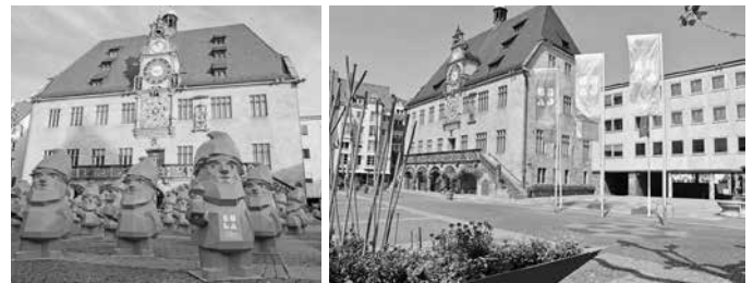
(Bild links:) Karl, das Maskottchen der BUGA 2019, vor dem historischen Rathaus der Stadt Heilbronn.