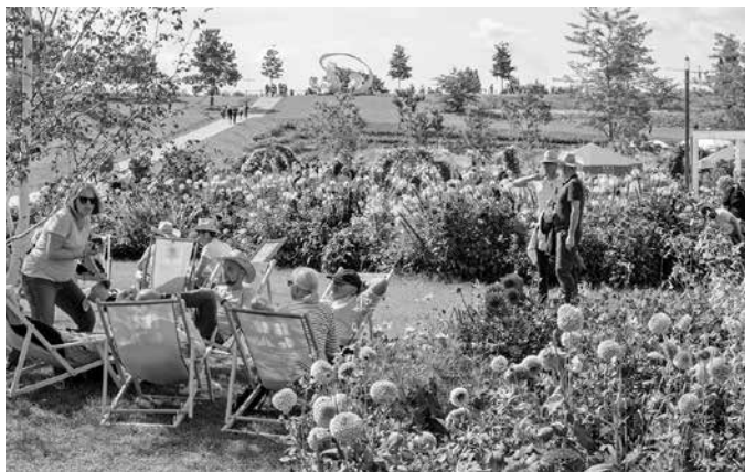
Urbanes Grün erlebten mehr als 2,3 Millionen Besuchende auf der Bundesgartenschau 2019 – dem heutigen neuen Stadtquartier Neckarbogen.

Am 17. April ist es genau fünf Jahre her, dass die Bundesgartenschau in Heilbronn eröffnet wurde. 173 Tage lang, bis zum 6. Oktober 2019, genossen Besucherinnen und Besucher die beeindruckende Schau auf dem Areal des jetzigen Stadtquartiers Neckarbogen. Mit ihr sind 17 Hektar Grünanlagen entlang des Neckars entstanden, die den Heilbronnerinnen und Heilbronnern auf Dauer bleiben.