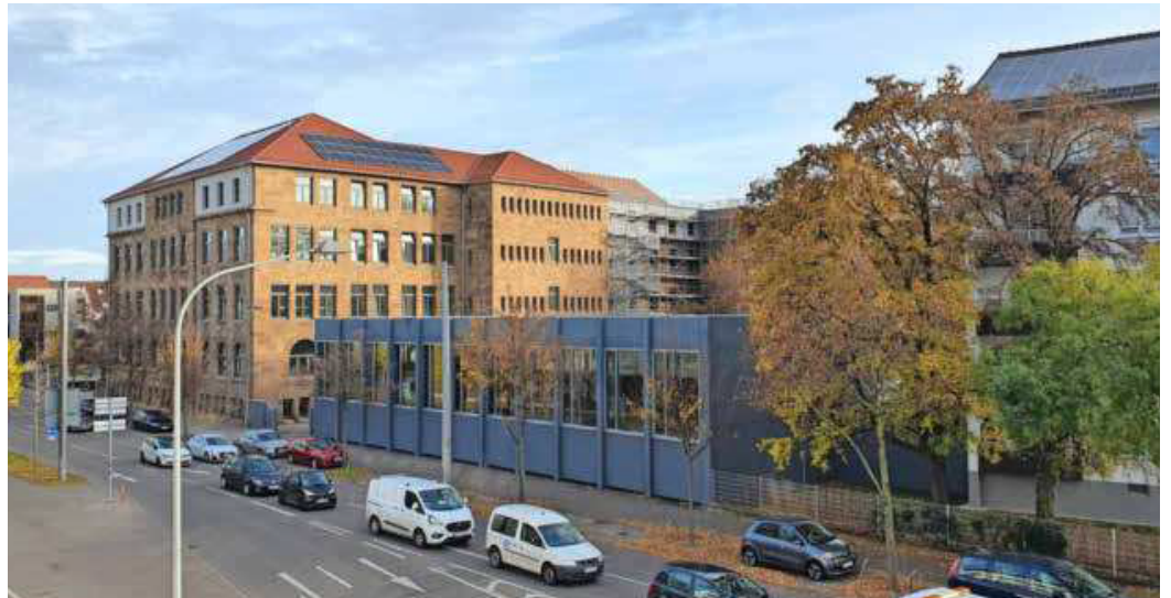
Königlich: Beiden neuen Decken handelt es sich um ein spezielles Leichtbausystem. Dieselben Decken wurden auch im Heidelberger Schloss eingebaut.

Rund 70 Prozent der Heilbronner entscheiden sich für eine Feuerbestattung. (red)