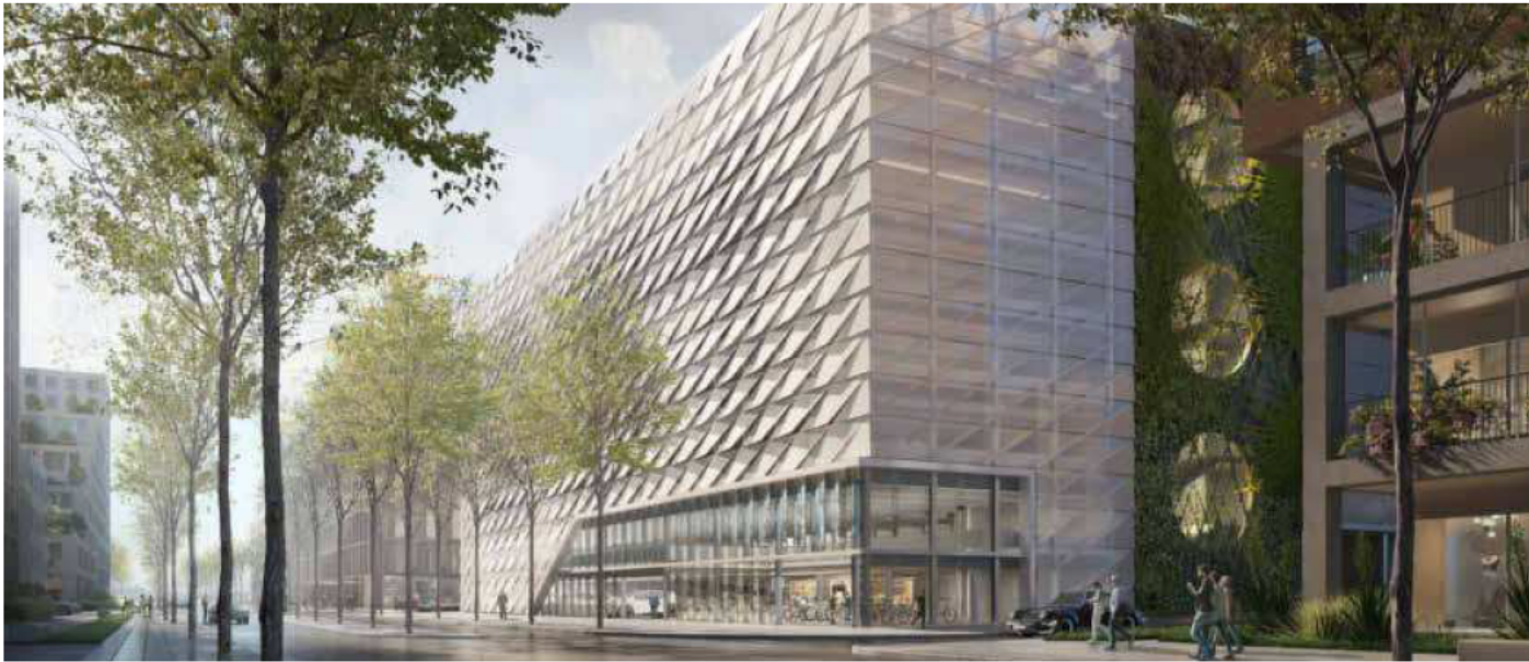
Passend zur Bebauung des Neckarbogens ist der E-Quartiershub individuell gestaltet. Visualisierung: Wittfoht Architekten, Stuttgart