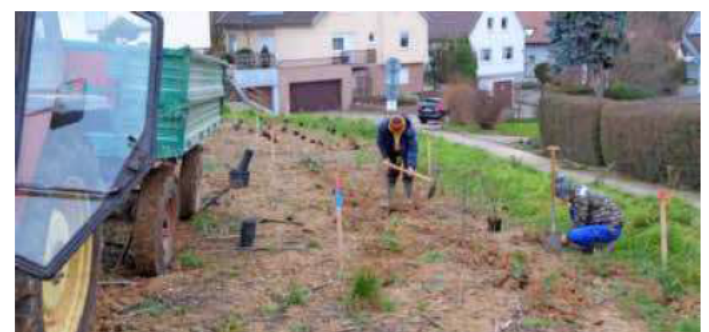
Auch im Gewann Kehle in Frankenbach sind neue Strauchhecken entstanden.

gleichzeitig dem Schutz vor Bodenerosion und der Speicherung von Oberflächenwasser. Die Gesamtfläche der auf diese Weise neu entstandenen Saumbiotop betragt mittlerweile etwa 75 Hektar. (red)