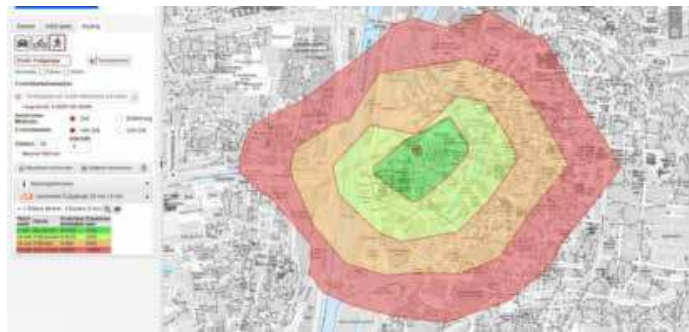
Mit der Erreichbarkeitsanalyse im Online-Stadtplan kann am PC angefragt werden, wann welche Ziele erreicht werden können.

grundkarte frei wählen und so statt des farbigen oder schwarz-weißen Stadtplans auch hochauflösende Luftbilder von 2020 einblenden. Auch europaweite Karten sind hinterlegt.