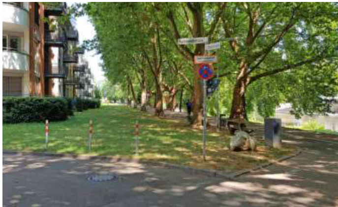
Dieser Wiesenstreifen zwischen Halbmondstraße und Kurt-Schumacher-Platz wird zum Radweg.

Die Umstellung der Straßenbeleuchtung auf umweltfreundliches LED wird weiter fortgeführt. Bis 2025 sollen ein Drittel aller städtischen Lichtpunkte umgestellt sein. (red)