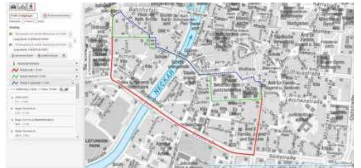
Service für unterwegs: Mit der Routingfunktion wird der schnellste Weg angezeigt.

Auf dem PC kann zusätzlich mit Hilfe des „Erreichbarkeits-Modus“ abgefragt werden, in welcher Zeit oder in welcher Entfernung von einem Ausgangspunkt bestimmte Ziele erreicht werden können. So kann zum Beispiel ermittelt werden, welche Orte vom Hauptbahnhof in fünf, zehn oder 20 Minuten zu Fuß erreichbar sind. Der Nutzer kann darüber hinaus die Hinter-