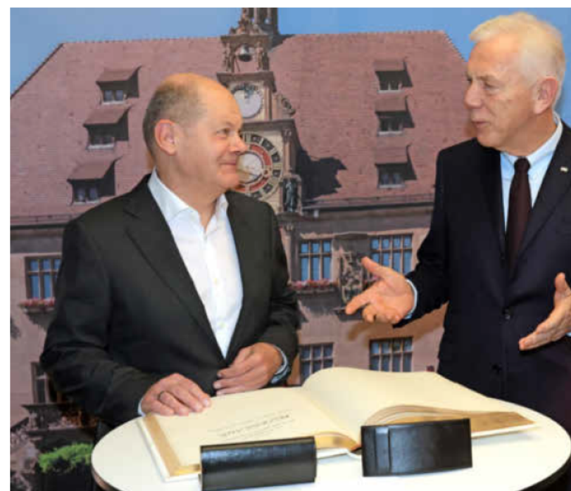
Bei seinem Besuch in Heilbronn trug sich Bundeskanzler Olaf Scholz ins Goldene Buch der Stadt ein.

Bevor es zurück ins Kanzleramt nach Berlin ging, trug sich der Hanseat und langjährige SPD-Politiker mit einer flotten Unterschrift ins Goldene Buch der Stadt Heilbronn ein. Das Buch ist übrigens ein gut gehüteter Schatz im Rathaus und im Tresor verschlossen. (mkk)