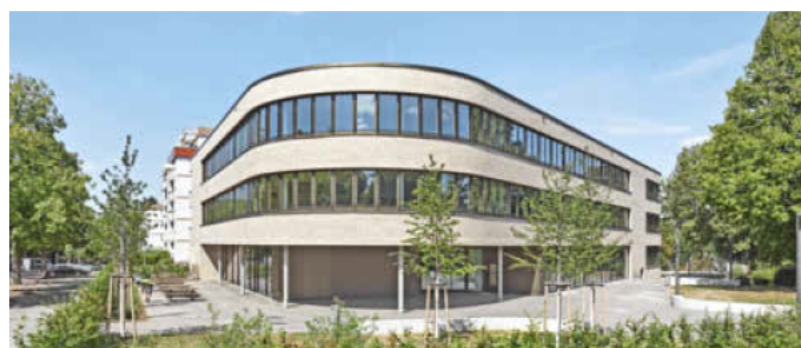
Drei ganz unterschiedliche Bauwerke: Theresienturm, Kindergarten Bernhäusle und Gerhart-Hauptmann-Schule (von oben).

nicht zuletzt maßstäblich bezüglich seiner Einfügung in das Quartier und für seine kleinen Nutzer, lautet das Urteil der Jury. Architekt war hier Joos Keller.