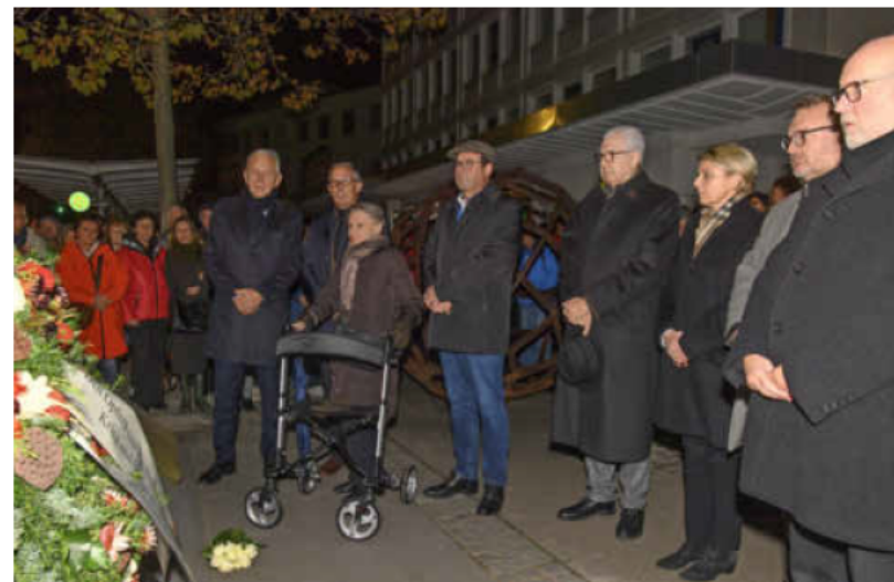
Im Gedenken an die Reichspogromnacht wurden Kränze am Synagogengedenkstein abgelegt.

INFO: Im Podcast „Heilbronner Geschichte(n)“ spricht Stadtarchivdirektor Christhard Schrenk zum jüdischen Leben in Heilbronn. Weitere Informationen unter https://heilbronner-geschichten.blogs.julephosting.de/ .